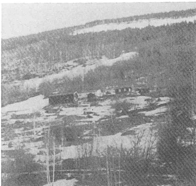
De to Tullut-plassene i Sel.